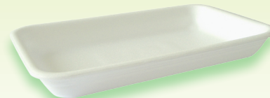
M13 - CX73/A - AT 73S 225x135x26