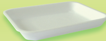
M07 - CX70 - AT 70 180x135x19