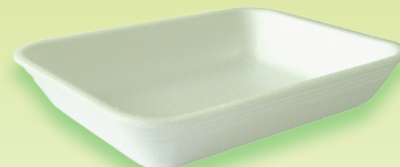
M07H - CX70/S - AT 70S 180x135x35