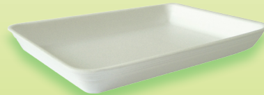
M05H - CX11/S 290x208x32