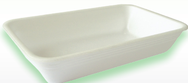
M03HH - CX73/S - AT 73 S4 225x135x42

Na zakázku je možné vyrobiť různé barevné varianty. Provedení - drenážní, bez absorbentů i s absorbenty.