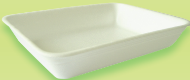
M13HH - CX25/S 225x175x41