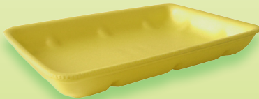
CX4/A žlutá - AT 4S 270x188x30