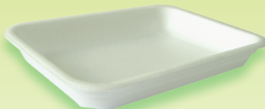
M17 - CX70/A - AT 70S 180x135x27